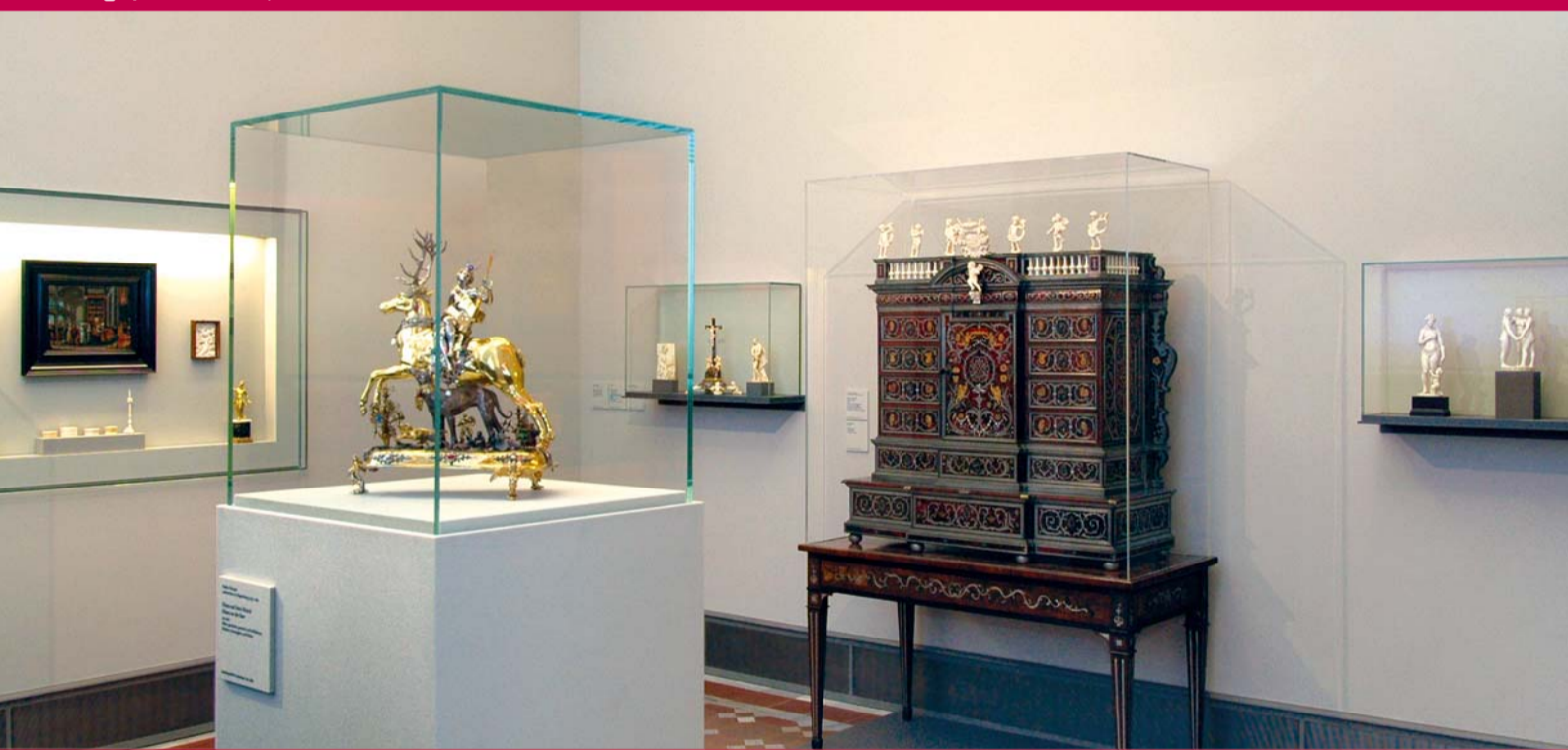
Die »Kunstkammer Würth« im Bode-Museum The »Kunstkammer Würth« in the Bode-Museum