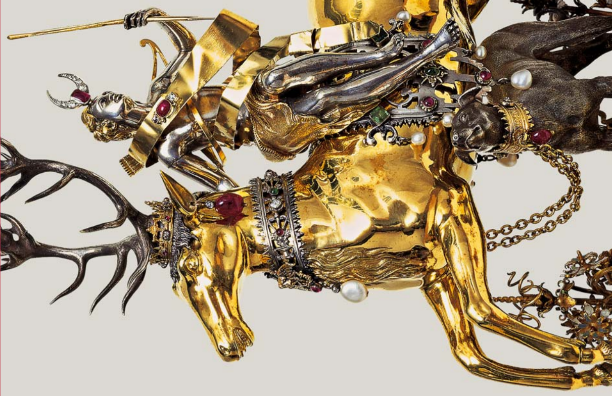
Titelblatt: Paulus Ättinger, Diana auf dem Hirsch, um 1600 Title page: Paulus Ättinger, Diana riding on a Deer, ca. 1600