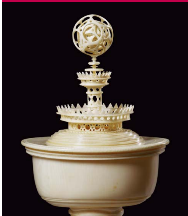
Deutsch, Ovaler Deckelpokal mit Contrefaitkugel, Elfenbein, um 1620 German, Oval Covered Cup with Hollow Sphere, ivory, ca. 1620