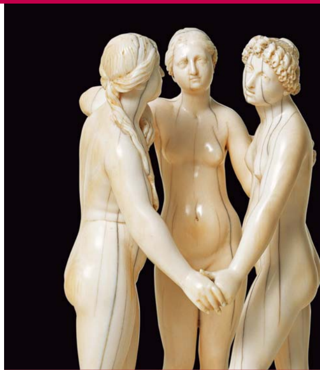
Leonhard Kern, Drei Grazien, Elfenbein, um 1650 Leonhard Kern, The Three Graces, ivory, ca. 1650

Aus Anlass der Wiedereröffnung des Bode-Museums im Oktober 2006 überlässt der Kunstsammler und Mäzen Reinhold Würth, dessen Sammlungsschwerpunkt vorwiegend auf dem Gebiet der klassischen Moderne und der zeitgenössischen Kunst liegt, der Berliner Skulpturensammlung für drei Jahre eine Auswahl von 28 Werken aus den Beständen seiner »Kunstkammer«. Hiermit findet die von Wilhelm von Bode gepflegte Zusammenarbeit zwischen Museen und Privatsammlern ihre Fortsetzung. Bei der »Kunstkammer Würth« handelt es sich vor allem um Kleinbildwerke des 17. und 18. Jahrhunderts. Unter den überwiegend aus Elfenbein gefertigten Preziosen finden sich Werke von so namhaften Künstlern wie Leonhard Kern, Joachim Henne und Adam Lenckhardt, aber auch von dem in Holz arbeitenden Christoph Daniel Schenck, der mit dem virtuos ausgeführten Relief »Der hl. Michael besiegt den Satan« vertreten ist. Neben diesen Kleinbildwerken bewahrt die »Kunstkammer Würth«